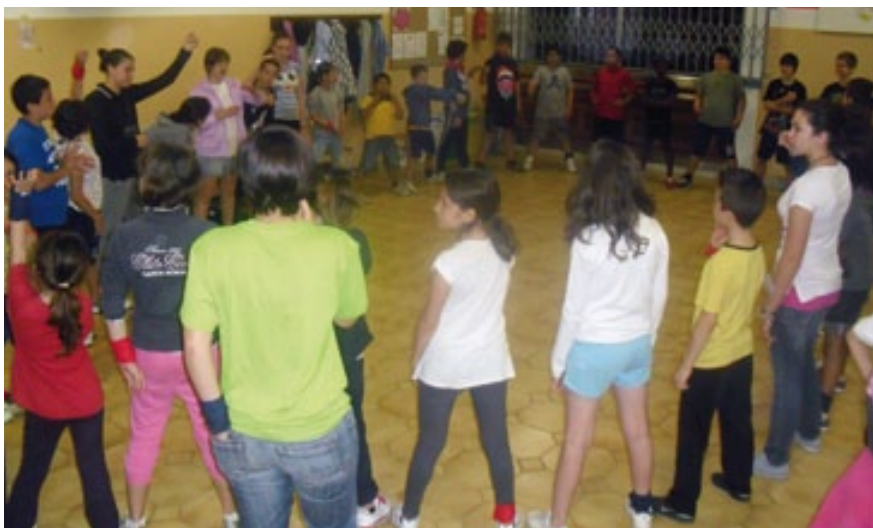
MOMENTI DI GIOCO E BALLI DI GRUPPO NELLE INTENSE GIORNATE TRASCORSE INSIEME AL GREST DI QUEST'ANNO.