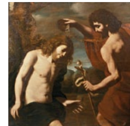
GUERCINO, BATTESIMO DI GESÙ (1600), PARTICOLARE