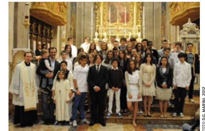
IN ALTO: LA FOTO DI GRUPPO DEI RAGAZZI DI QUINTA ELEMENTARE CHE HANNO RICEVUTO PRIMA COMUNIONE E CRESIMA IL 6 MAGGIO; AL CENTRO: FOTO RICORDO PER I RAGAZZI DI TERZA MEDIA, CRESIMATI IL 13 MAGGIO; IN BASSO: IL NUMEROSO GRUPPO CHE HA PARTECIPATO ALLA GITA-PELLEGRINAGGIO A SAN PIETRO IN LAMOSA E AL SANTUARIO DELLA MADONNA DELLA NEVE DI ADRO SVOLTASI IL 30 MAGGIO SCORSO.