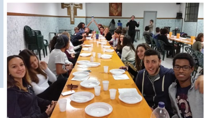
SEDUTI A TAVOLA, ADOLESCENTI ED ANIMATORI ATTENDONO LA MERITATA CENA DOPO IL MOMENTO DI FORMAZIONE VISSUTO INSIEME

Gli incontri per i ragazzi delle superiori ed oltre si tengono a domeniche alterne: i prossimi appuntamenti sono previsti per il 2, 16 e 30 novembre a Cristo Re, seguiti, come di consueto, da una cena tutti insieme in allegria nel salone della parrocchia. Vi aspettiamo!