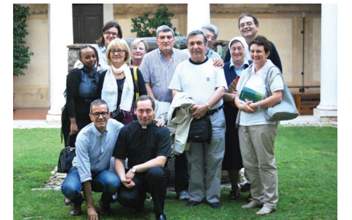
FOTO DI GRUPPO CON ALCUNI MEMBRI DEL CPP ALL'INTERNO DEL CHIOSTRO DELLA CASA DEI DIACONI PERMANENTI