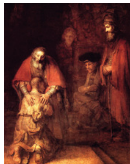
IL PADRE MISERICORDIOSO IL CELEBRE DIPINTO DI REMBRANDT DEL 1666 ISPIRATO ALLA PARABOLA DESCRITTA NEL VANGELO DI LUCA (Lc 15,11-32)

La prima verità della Chiesa è l'amore di Cristo. Di questo amore, che giunge fino al perdono e al dono di sé, la Chiesa si fa serva e mediatrice presso gli uomini. Pertanto, dove la Chiesa è presente, là deve essere evidente la misericordia del Padre. Nelle nostre parrocchie e dovunque vi sono dei cristiani, chiunque deve poter trovare un'oasi di misericordia. Questo è il momento favorevole per cambiare vita!" ■