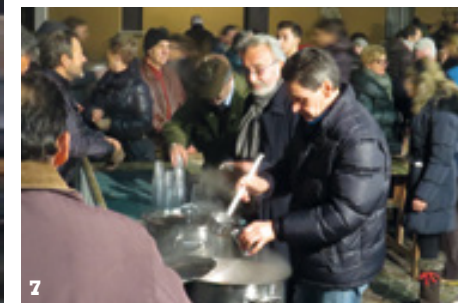
6. LA COMPAGNIA TEATRALE PARROCCHIALE "IL GABBIANO" NELLA COMMEDIA "SPUSAS COME MARIDAS LIÈ SÈMPER EN GRAN BEL PAS!" 7. PER I "GOLOSÌ": BROSTOI E VIN BRÛLÉ...