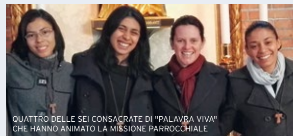
QUATTRO DELLE SEI CONSACRATE DI "PALAVRA VIVA" CHE HANNO ANIMATO LA MISSIONE PARROCCHIALE