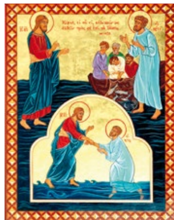
GESÙ CAMMINA SULLE ACQUE E PIETRO CON LUI. ICONA REALIZZATA NEL LABORATORIO DELLA GLIKOPHILOUSA, COMUNITÀ DEL PICCOLO EREMO DELLE QUERCE, SANTA MARIA DI CROCHI (DIOCESI DI LOCRI-GERACE)

Nonostante le paure e le tensioni dobbiamo vivere la speranza, senza perderci d'animo, e come gli Apostoli nel brano di Matteo, cap. 14,23-28: partiamo perché ce lo dice Gesù