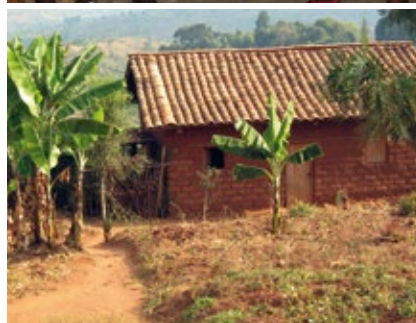
IN ALTO, SONO CON ALCUNE RAGAZZE ALL'INTERNO DEGLI AMBIENTI DELLA SCUOLA LOCALE. IN BASSO, UNA DELLE ABITAZIONI DEL LUOGO, SPESSO REALIZZATE SOLO CON MATTONI E TERRA, SENZA ELETTRICITÀ NÉ SERVIZI IGIENICI DI SORTA