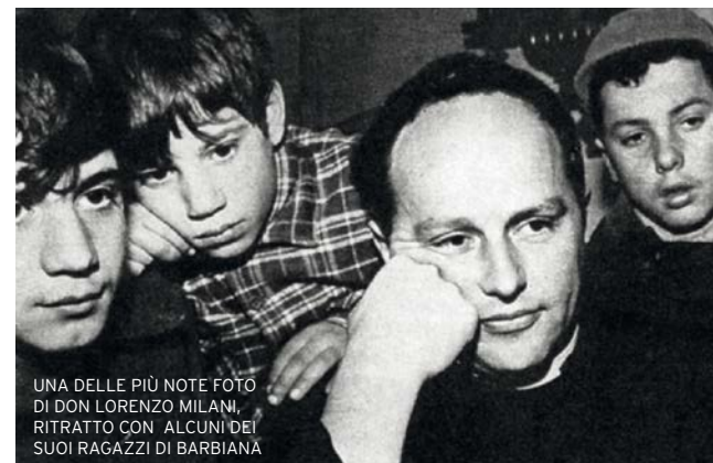
UNA DELLE PIÙ NOTE FOTO DI DON LORENZO MILANI, RITRATTO CON ALCUNI DEI SUOI RAGAZZI DI BARBIANA

Non dimentichiamo infine che la Chiesa "condannò" Don Milani, e solo recentemente vi è stata la sua riabilitazione da parte di Papa Francesco che lo ha definito "Servo esemplare del Vangelo" recandosi in pellegrinaggio alla sua tomba.