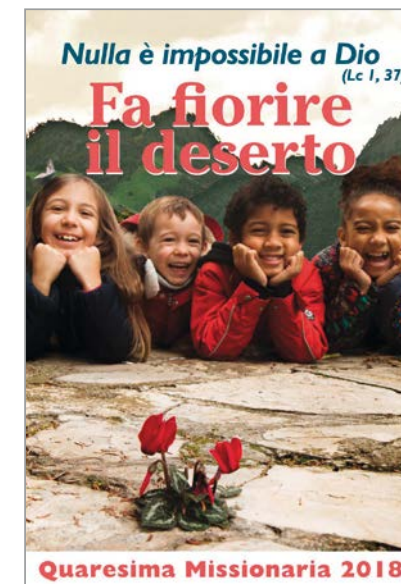
LA RIPRODUZIONE DELLA LOCANDINA PER L'EDIZIONE 2018 DELLA QUARESIMA MISSIONARIA. IN ALTO A DESTRA, LA BANCARELLA DELLE ICONE REALIZZATE DAI RAGAZZI DELL'ORATORIO, VENDUTE PER CONSENTIRE IL FINANZIAMENTO DI CINQUE PROGETTI MISSIONARI DIOCESANI.

Davvero il Signore fa fiorire il deserto anche in mezzo alla nostra comunità, davvero la Missione è ancora possibile, come abbiamo imparato dal festival missionario dello scorso ottobre, proprio perché nulla è impossibile a Dio!