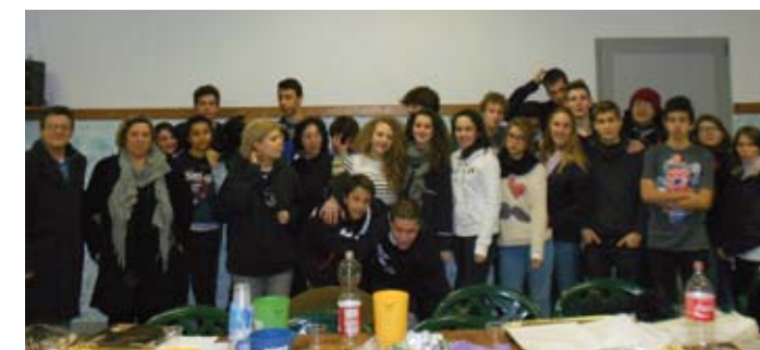
IN ALTO, LA LOCANDINA DEL CAMMINO QUARESIMALE PER LE FAMIGLIE, PROPOSTO QUEST'ANNO DALLA DIOCESI DI BRESCIA A DESTRA, IL NUTRITO GRUPPO DI ADOLESCENTI, GIOVANI E CATECHISTI AL TERMINE DELL'INCONTRO DI CATECHESI

I più piccoli sono invece aiutati da un bel matitone a riconoscere e, ci auguriamo, a scrivere nella loro vita i "segni della Salvezza" che ci accompagnano, uno per ogni settimana, fino al Segno per eccellenza che è la Croce, attraverso la quale Cristo ci salva nella sua Pasqua di Resurrezione. ■■