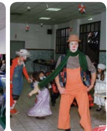
IL DIVERTIMENTO NON HA ETÀ! SOPRATTUTTO A CARNEVALE. ANCHE QUEST'ANNO INFATTI LO SVAGO E LA FESTA HANNO COINVOLTO GIOVANI E "MENO GIOVANI" TRA GIRI DI VALZER E ALLEGRE SFILATE IN COLORATISSIMI COSTUMI. PRINCIPI, PRINCIPESSA, MESSICANI, CLOWN, CARDINALI E TANTISSIME ALTRE MASCHERE SI SONO MESCOLATE ALLEGREMENTE IN ORATORIO TRA CORIANDOLI, STELLE FILANTI, LATTUGHE E FRITTELLE A VOLONTÀ