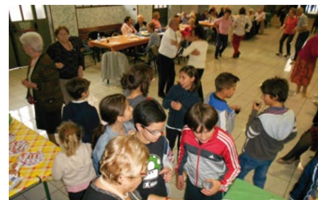
LA NOSTRA COMUNITÀ, HA VISSUTO IL 2 OTTOBRE SCORSO UN PIACEVOLE POMERIGGIO DI GIOIA IN ORATORIO PER CELEBRARE LA FESTA DEGLI ANGELI CUSTODI. ISTITUITA NEL 2005, QUESTA RICORRENZA SOTTOLINEA L'IMPORTANZA DEL CONTRIBUTO DEI NONNI ALL'INTERNO DELLE NOSTRE FAMIGLIE E DELLA SOCIETÀ ODIERNA