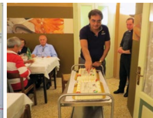
MARTEDÌ 17 SETTEMBRE, NELLA BELLISSIMA ED ACCOGLIENTE VILLA PACE DI GUSSAGO, ABBIAMO CELEBRATO UNA SANTA MESSA DI RINGRAZIAMENTO PER TUTTI I VOLONTARI DELLA NOSTRA PARROCCHIA. È SEGUITA UNA GIOIOSA CENA FRATERNA CON IL TRADIZIONALE TAGLIO DELLA TORTA. ANCORA UN GRAZIE AI NOSTRI VOLONTARI!