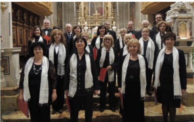
LA CORALE "CRISTO RE" IN POSA ALL'INTERNO DELLA NOSTRA BELLA CHIESA E, IN ALTO, ALCUNI DEI COMPONENTI DEL GRUPPO DI CANTO CHE COLLABORA NELL'ANIMAZIONE DELLA MESSA DOMENICALE DELLE ORE 10

Un prossimo concerto, dopo quello di giugno, si terrà nell'ambito delle celebrazioni in onore della festa di Cristo Re, il prossimo sabato 23 novembre alle ore 20,45 in chiesa. ■