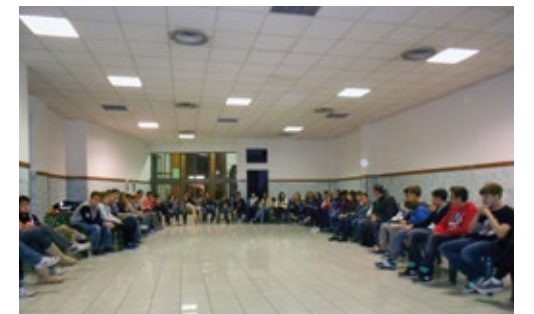
IN ALTO , IL GRUPPO DEI CATECHISTI DURANTE IL MOMENTO DI FORMAZIONE IN BASSO , ADOLESCENTI E GIOVANI RIFLETTONO SUL TEMA PROPOSTO ALL'INIZIO DELL'INCONTRO

Aspettiamo tutti i ragazzi, dalla prima superiore in su, ogni 15 giorni all'oratorio di Cristo Re alle 19:30. ■