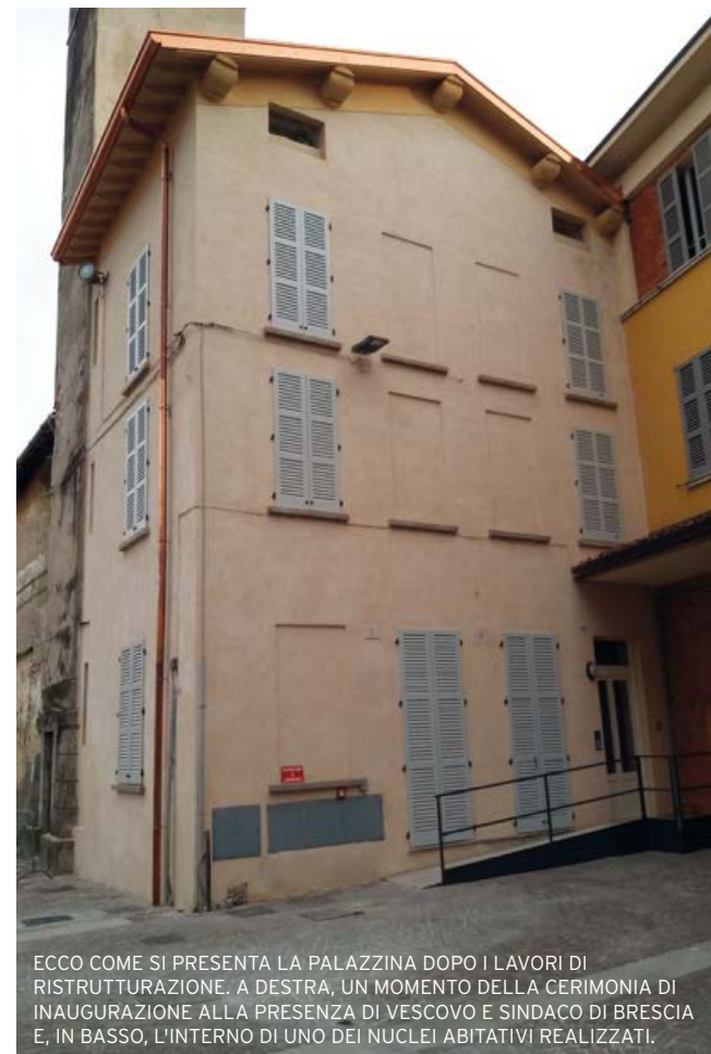
ECCO COME SI PRESENTA LA PALAZZINA DOPO I LAVORI DI RISTRUTTURAZIONE. A DESTRA, UN MOMENTO DELLA CERIMONIA DI INAUGURAZIONE ALLA PRESENZA DI VESCOVO E SINDACO DI BRESCIA E, IN BASSO, L'INTERNO DI UNO DEI NUCLEI ABITATIVI REALIZZATI.

L'iniziativa Il Borgo Accogliente ha preso avvio con l'intervento di risanamento con recupero funzionale dell'im-