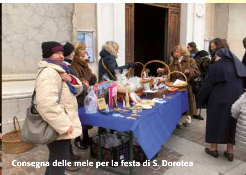
Consegna delle mele per la festa di S. Dorotea