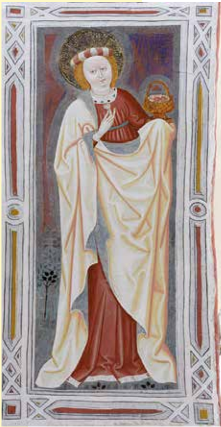
Affresco di S. Dorotea nella chiesa di San Giacomo ad Ortisei. Anonimo del 1400